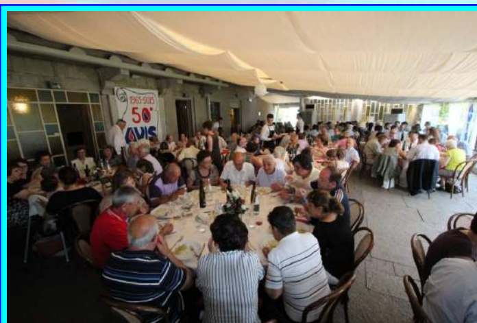
PRANZO SOCIALE IN VILLA BUTTAFAVA

In conclusione nota dolente, nello scorso mese di no-