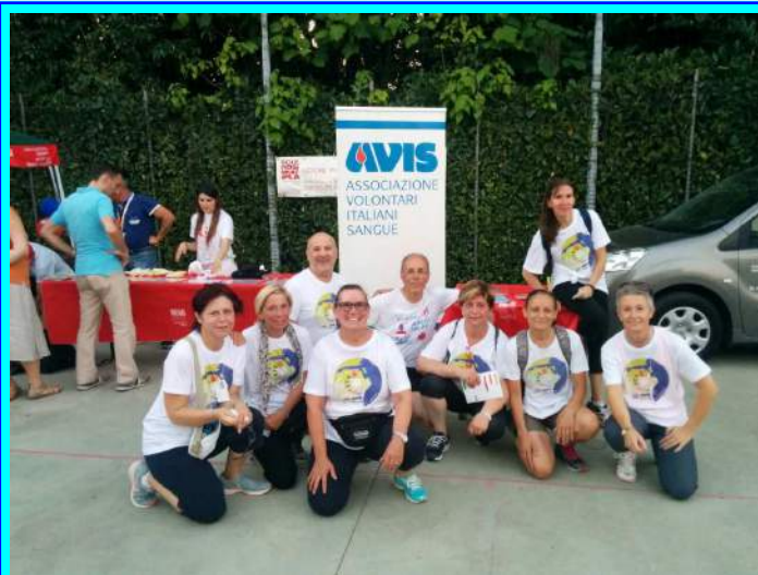
GRUPPO AVIS CASSANO ALLA CAMMINATA AISM

Camminare può diventare un primo passo per il recupero della forma fisica e per la pratica di attività più impegnative. Praticare in modo costante e regolare esercizio fisico, influisce positivamente sui sistemi: respiratorio, cardiovascolare, endocrino-metabolico, immunitario e locomotore. Per contro, va ricordato che la sedentarietà contribuisce in modo significativo alla morbilità e alla disabilità.