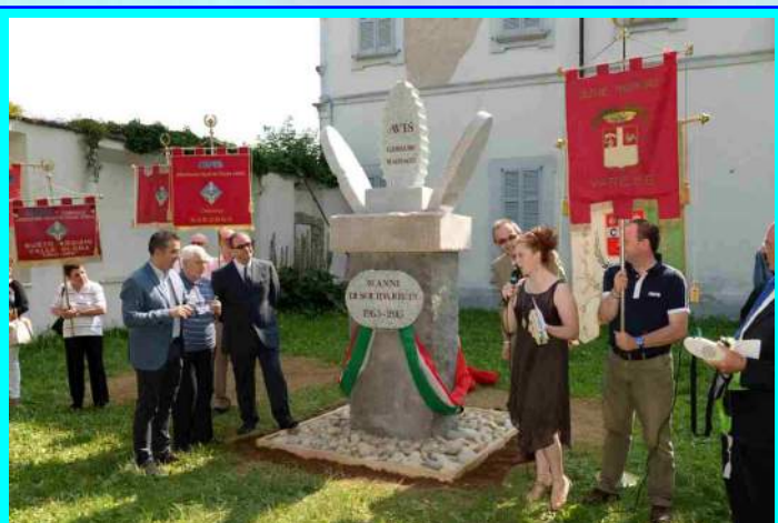
INAUGURAZIONE MONUMENTO AVIS CASSANO M.

Periodico di informazione della sezione AVIS di CASSANO MAGNAGO (VA) - Anno VIII - Numero 18 - Novembre 2015