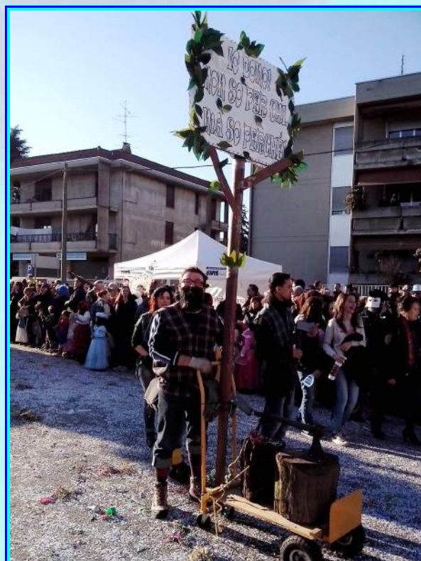
Il nuovo slogan al "debutto" durante il recente carnevale