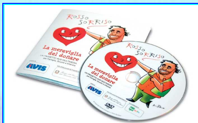
Progetto Rosso Sorriso

Alla presenza anche del Presidente di AVIS Nazionale Dott. Saturni sono stati prima elencati i numeri della gestione 2013 che vedono nel totale 25'160 donatori in provincia, in aumento rispetto ai 24'907 del 2012. In leggero calo invece le donazioni che sono passate da 44'888 del 2012 a 43'928 del 2013. Questo ultimo dato, che a primo avviso potrebbe sembrare negativo e preoccupante, ci è invece stato spiegato essere un segnale di buon lavoro fatto nel campo della razionalizzazione e nella gestione delle risorse. Infatti il sangue raccolto non può essere conservato a lungo ma ha purtroppo una scadenza tem-