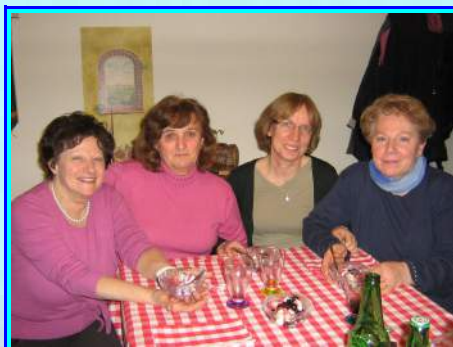
Le nostre sarte

prossimo vorremmo riproporla cercando di coinvolgere più persone possibili così da non passare inosservati. La ciurma dell'AVIS è sempre pronta ad arruolare chiunque voglia unirsi al suo equipaggio al motto di: