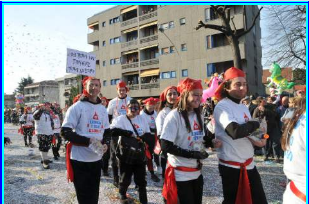
Gruppo Avisino durante la sfilata

Senza dubbio è stata un'esperienza positiva e l'anno