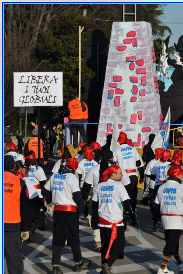
Gruppo Avisino durante la sfilata