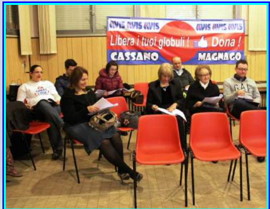
Assemblea AVIS Cassano Magnago